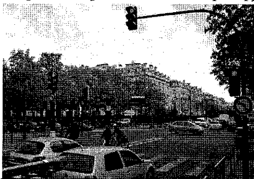
Porte de Passy : interdiction de tourner vers le Bois

Il est dommage de ne pas essayer ces améliorations alors que l'aménagement du boulevard Suchet pour tourner à gauche et rejoindre le Bois (chaussée et feux), qui nous est proposé, risque de créer des embouteillages supplémentaires aux heures d'affluence.