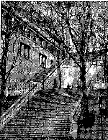
Les 99 marches de l'av. du Parc de Passy

« Les conséquences de ce manque de concertation avec les riverains ne sont pas négligeables : les locaux prévus sont encombrés par des sacs individuels voire d'ordures dont le stockage pendant plusieurs jours fait la joie des rats et des cafards. Bref, odeurs et insalubrité s'installent avec la mauvaise humeur des gardiens préposés qui ne peuvent plus assurer convenablement l'hygiène des immeubles, et les poubelles devenues trop lourdes ne peuvent souvent plus être manipulées par une seule personne.