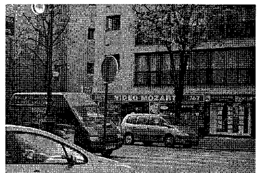
une intersection avec une visibilité réduite

Les habitants veulent plus de sécurité, mais pas forcément des feux, même si le feu reste un symbole de sécurité dans le subconscient de la population.